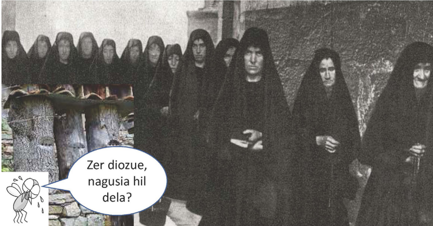
Erleek ere lutoa mantentzen zuten.

Praktika honen lekukotasun asko aurkitu ditut. Hona batzuk: