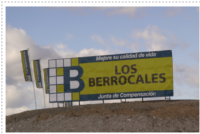
Irudia ~ 03 postala. Aurrealdea.

Bestalde, aztarnak oharkabean pasa litezke, ez badugu ezartzen modu kontziente batean tenporaltasunaren muga definitzen duen atari hori. Pertzepzioa ezberdina da norbanako bakoitzean, haien pertzepzio-atariak ezberdinak batira. Aztarnen gorputza gertakarien bibrazioak jasotzen dituen hartzaile material bat da eta esperientzia tenporalean mugak sortzen ditu beste tenporaltasun batzuetara jotzea ahalbidetzen duelako.