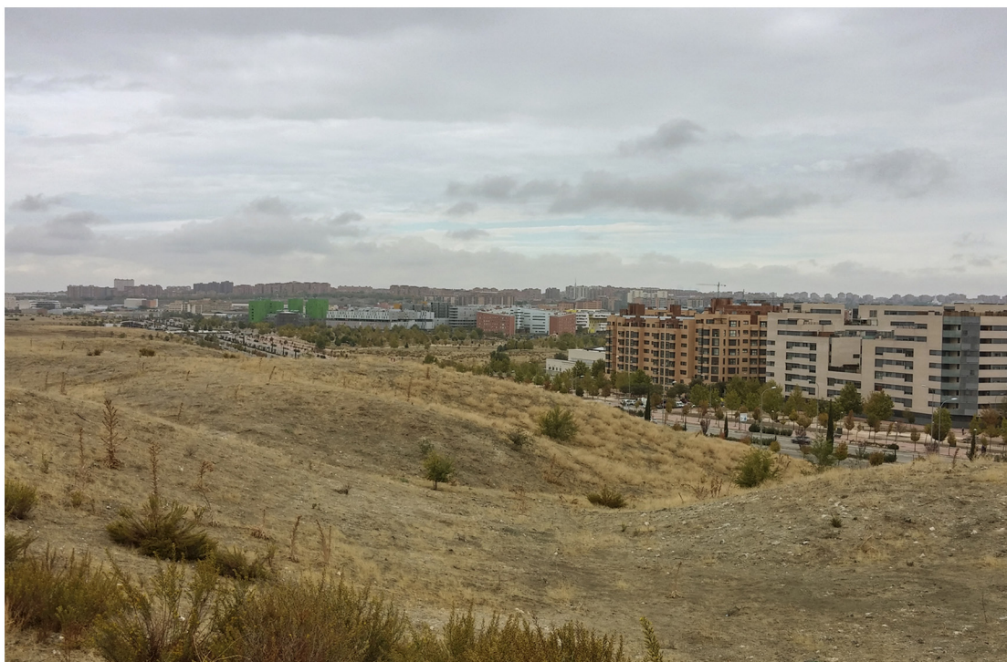
Irudia ~ 01 postala. Aurrealdea.