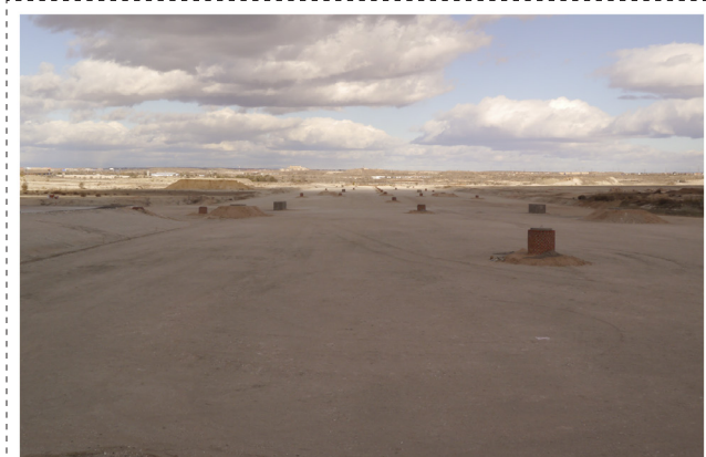
Irudia ~ 04 postala. Aurrealdea.