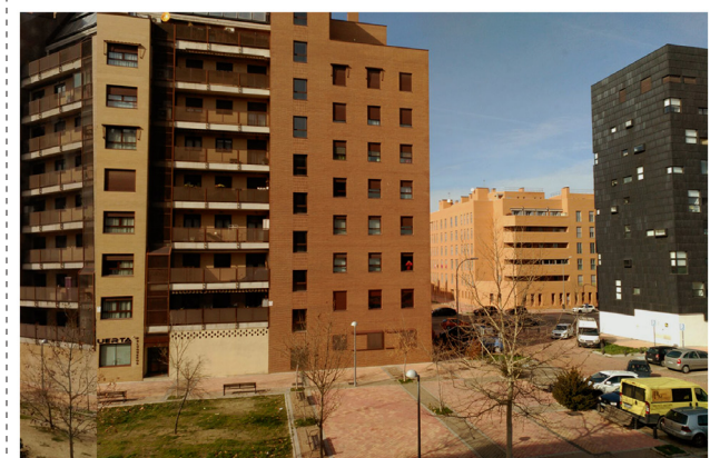
Irudia ~ 06 postala. Aurrealdea.