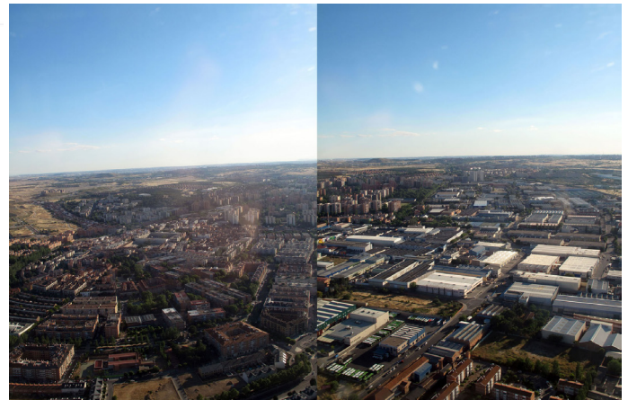
2. irudia ~ Hegan goazela harturiko «suburbiako» argazkiak.

beharbada eremu «periurbanoak» lirateke, hiri puztuak lurraldearekin lausotzeko joera duten muga zabalak, funtzio mistodun espazio mamituak; «ikus-zarata» edonon, hiriek zorua zinez «jaten» duten zerbitzuak lurraldera «jarturiki» izatearen patua tokatu zaien aldiriak. Eszenografiaren «katzealde funtzionalak», hutsalaren narrazioz eta «operazio dialektiko sinplez» «ezaugarri negatibo eta generikotasun globalarekin lotzen dituzten ideiak» (Uriarte, 2013a: 32); «tarteko» arrapostuak beharko lituzkeelarik 1 . Gaur eguneko aditu askok batzuetan «metropoli-eskualde» nozioa darabilte, haren anbiguotasunagatik gustuko ez duguna, nahiz eta besteek, teorikoki konprenigarriagoak izanagatik, anbiguotasuna beren hiri-bihotzean eta lurralde-gorputzean daramaten.