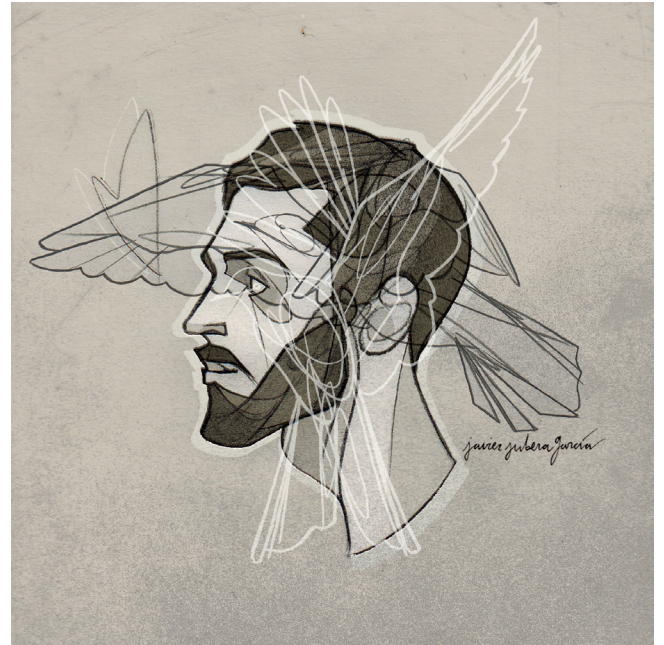
Irudiaren egilea – Javier Jubera – www.javierjubera.com