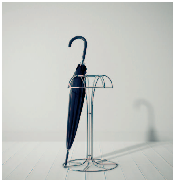
Goian eta ezkerrean, MARC aldizkari-gordailu eta mahaia eta behean eskumaldean, CAMPS euritako-gordailua.

“Diseinatzaile talde gaztea garen arren, baditugu lan-prozesuan komunak diren zenbait helburu. JORGE aldizkari-gordailua har dezagun kasu. Produktzio-kostu baxuen baldin-tzapean, objektu sinplea, arina eta funtzionala gailendu da. Altxairubodien industrializazioa erraza da eta gainera pisu gutxi du, eskuz maneiagarri izatea abantaila handia da eta oso kontuan hartzekoa.