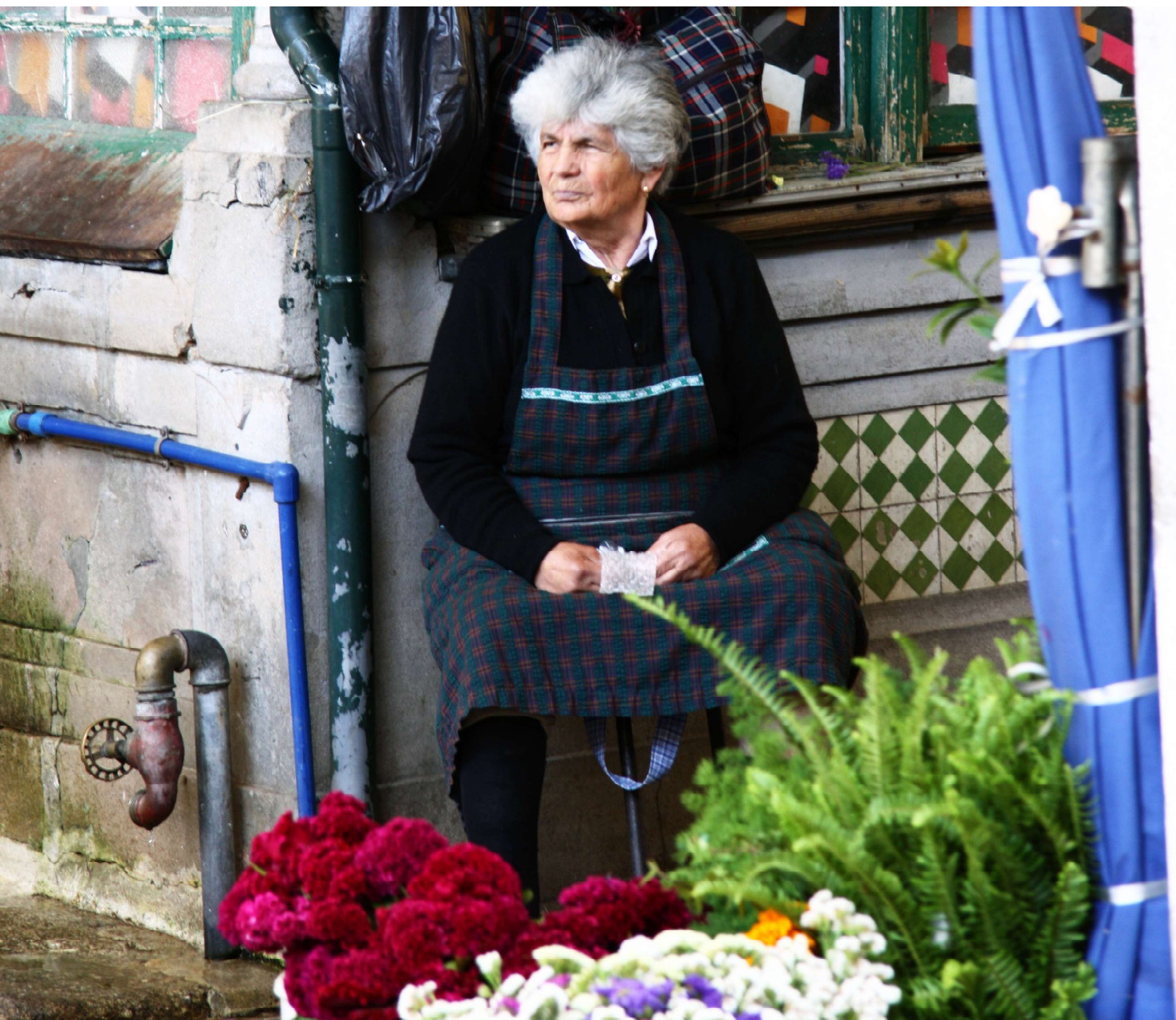
Irudia ~ Zahartzaroaren errepresentazio berria.