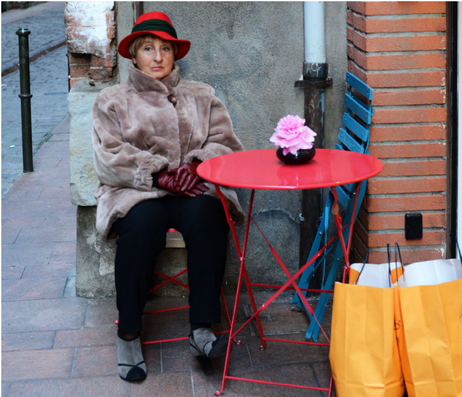
Irudia ~ Zahartzaroaren errepresentazio zaharra. Egilea ~ Itsaso Larramendi (2011); Flickr ilarramendi

ez du zentzurik. Horrenbestez, hiria dena baino dirudiena da garrantzitsuagoa, helarazten duena, munduari esan behar diona. Hiri produktiboa nahi dugu, garbia, irudi finkoa proiektatzen duen izaki aldaezina, betirakoa. Errealitatea, aldiz, oso bestelakoa da. Hiria zikina ere bada, gatazkatsua, erreproduktiboa, aldakorra, hilkorra... desagertu ere egiten da eraitsitako eraikin bakoitzean. Hala ere, horren errepresentazioek irudi homogenea sortzen dihardute, hiriak beregain dituen beste hainbat izaera desagerrarazten. Ukatzen diren ezaugarriok erantsiz ikuspuntu berriak sortzen dira, gehikuntzek ikusmolde aberatsagoak sortzen baitituzte.