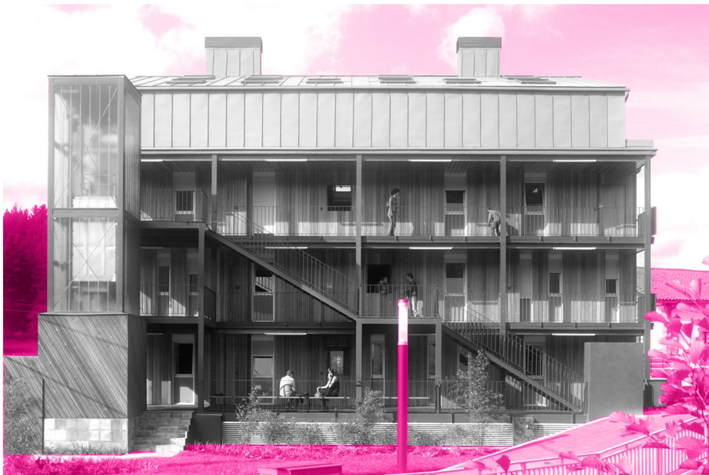
“Zubimusu Etxea”: 9 etxebizitza Gabirian (Gipuzkoa)