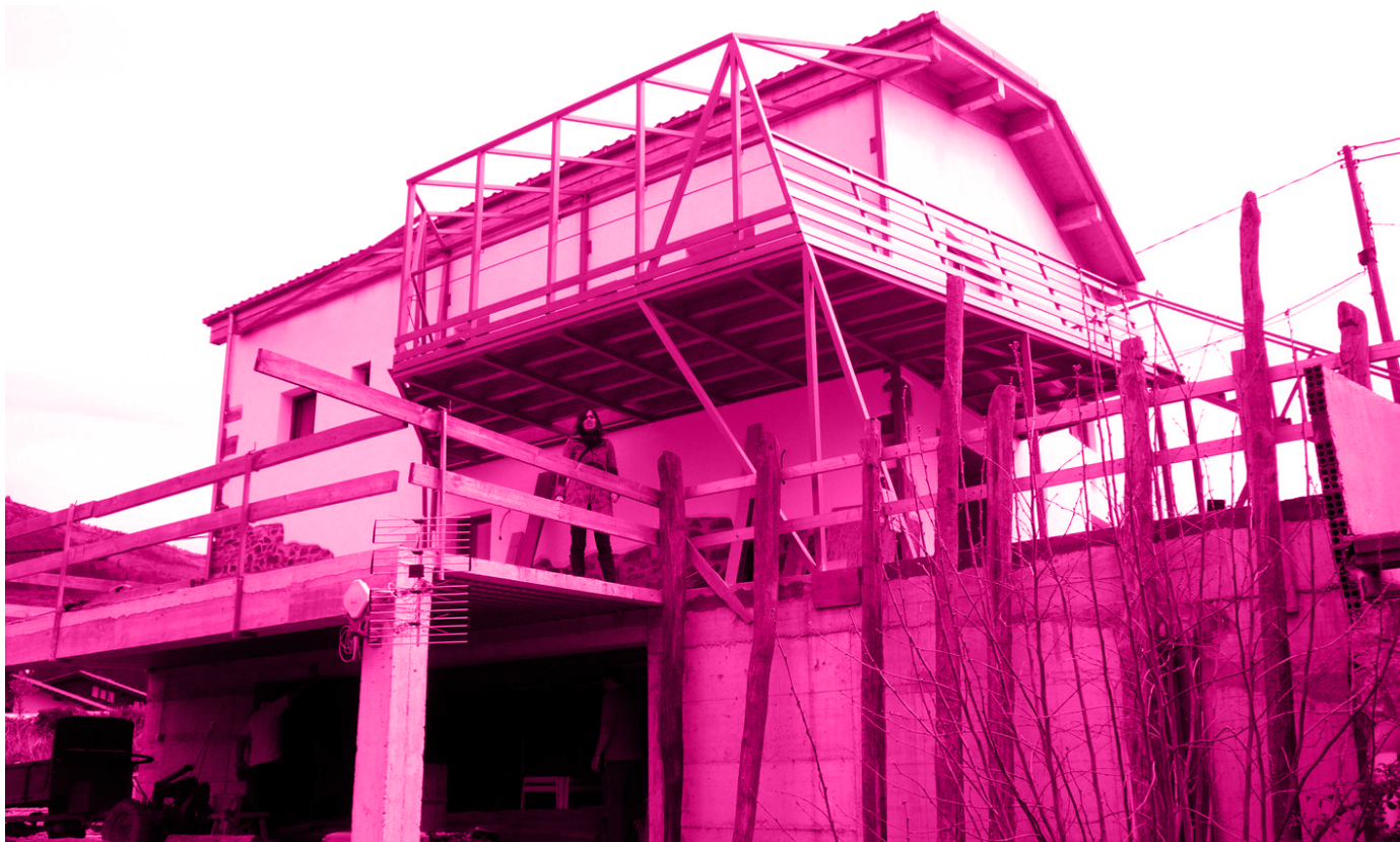
“Anderjaus”: Etxe-eraberritzea Ezkion (Gipuzkoa)