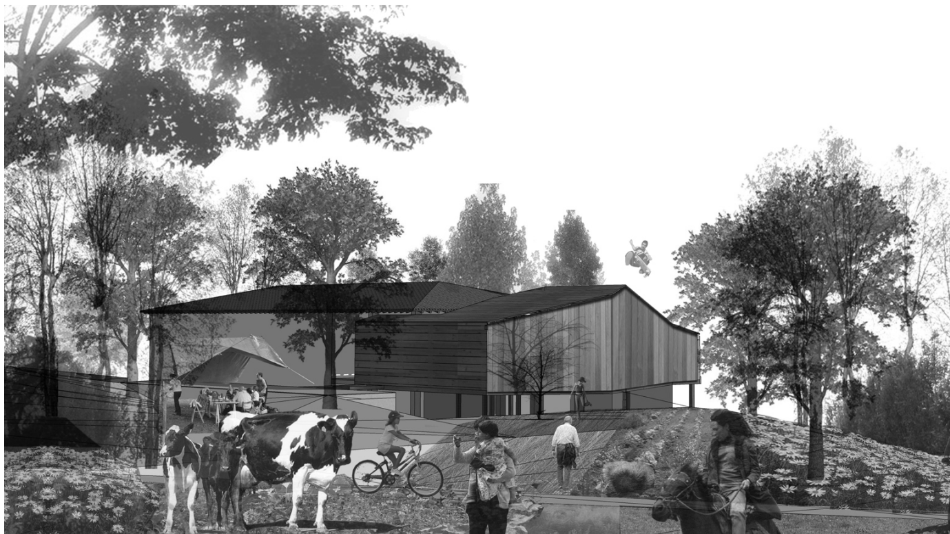
“SB Parkea”: Santa Barbara ermitaren eranskin-eraberritze eta -handipena Urretxun (Gipuzkoa)