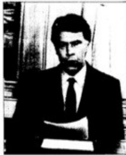
Consejero proclamando oficialmente la victoria.