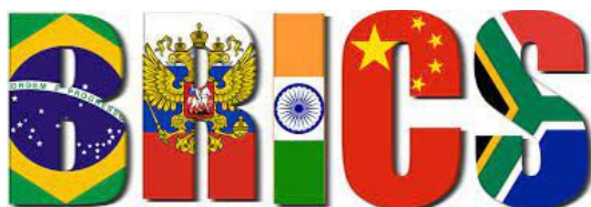
The seeds of BRICS