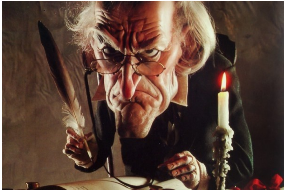
The typical accountant (ekonomiaz jantzi, 2014/01/29)