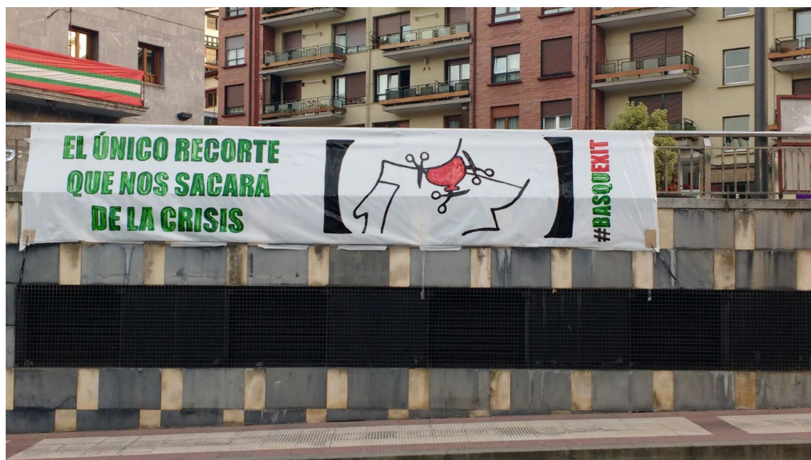
(Alonsotegin ateratako fotografia)

Eurexit, Brexit, Grexit, Italexit, ... Catexit..., Lexit, ...Basquexit, ... EHexit (UEUko blogean: askotan eta aspalditik)