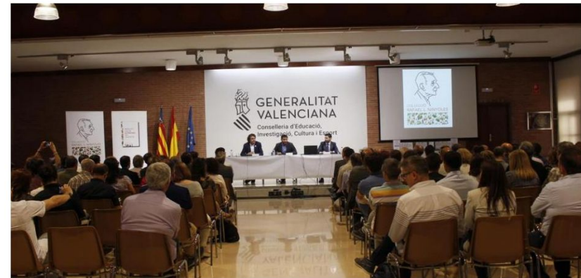
Presentación del estudio sobre el impacto económico del valenciano (LVD)

• El castellano y el euskera ya disponen de un informe similar con impactos de 164.000 y 2.800 millones de euros, respectivamente