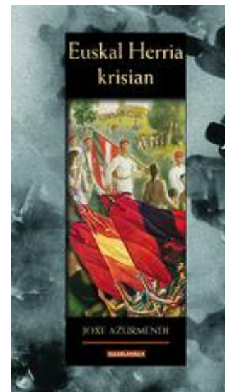
Euskal Herria Krisian (1999)